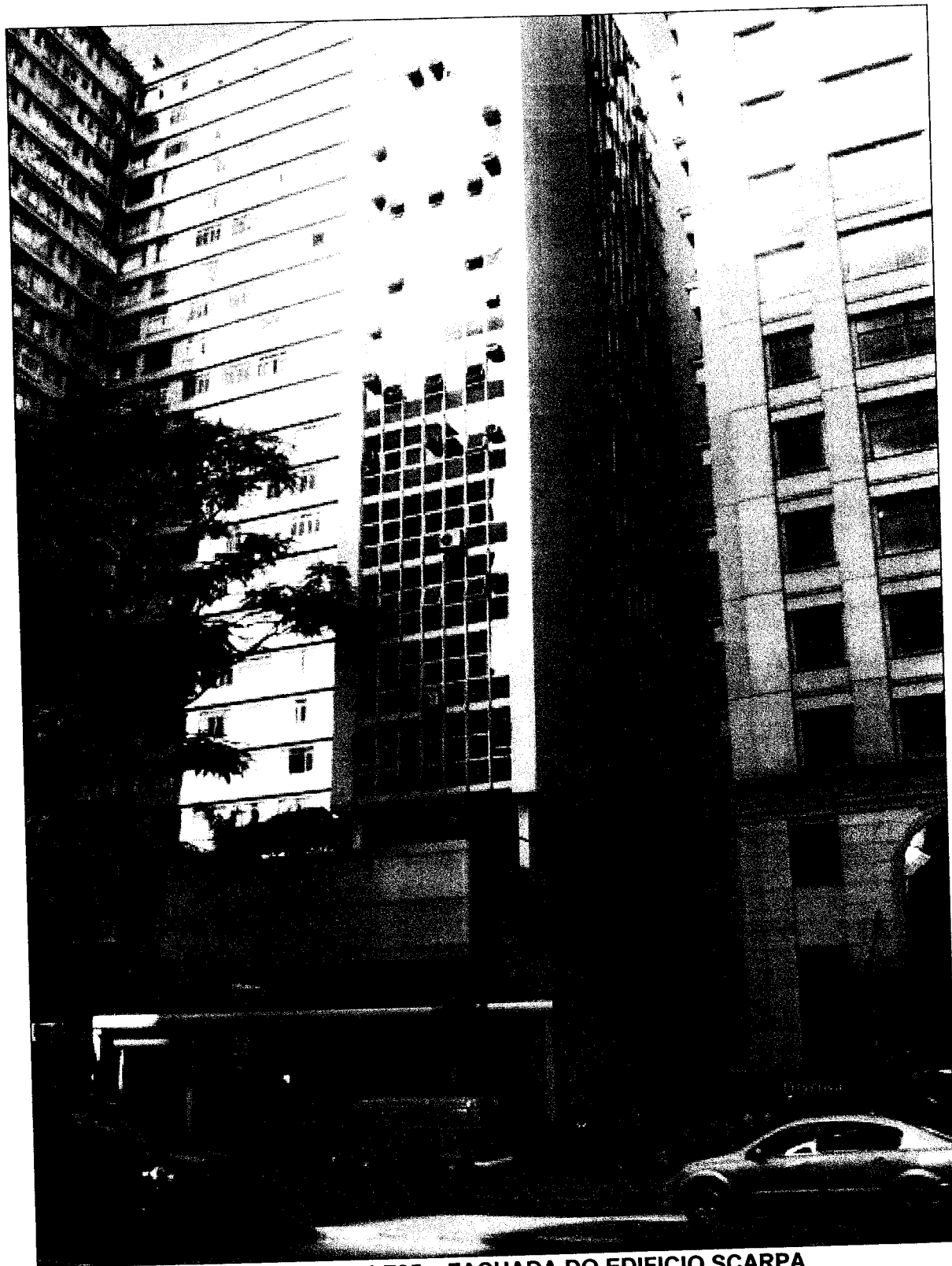
AV. PAULISTA, 1.765 – FACHADA DO EDIFÍCIO SCARPA